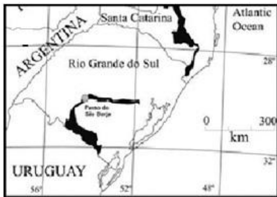
Figura 1. Mapa com indicação da localização do afloramento Passo do São Borja e em preto locais onde aflora a Formação Irati no RS e SC.