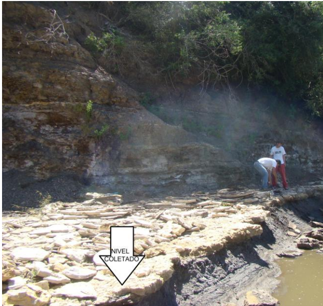
Figura 2. Foto do afloramento com seta indicando o nível das coletado.